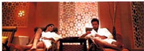
Erholung im Oriental SPA