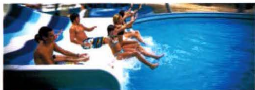
21 Becken mit 3.000 m 2 Wasserfläche

Weitere Infos: www.vitality-world.com www.aquaworldresort.hu