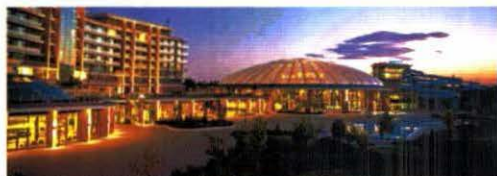
Einzigartiges Angebot auf 8,6 Hektar