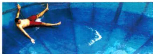
11 Rutschen mit 1.000 m Gesamtlänge